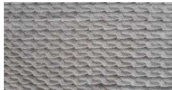
HILADO MEJORADO GESTIÓN 2021