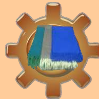
PRODUCCIÓN DE PRENDAS